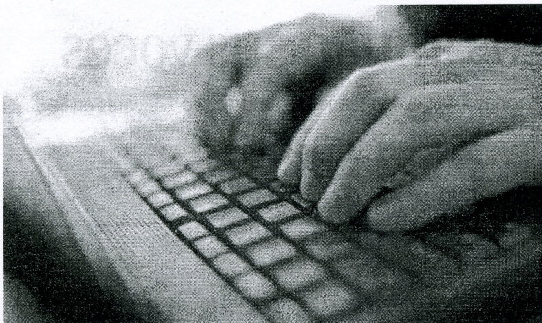
El objetivo de este evento es acercar e impregnar los valores de la Web Social en la sociedad onubense. INFORMACIÓN